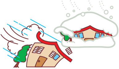
台風や大雪による被害